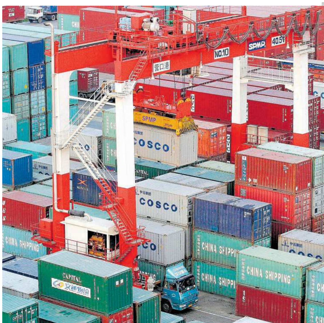
COLAPSO EN EL TRANSPORTE EL TRASLADO DE MERCANCIAS SUFRIÓ UNA GRAN PARALIZACIÓN DURANTE EL PASADO AÑO.

cando políticas laxas que no han terminado de dar su fruto todo lo rápido que se esperaba, especialmente en España. Los bancos centrales mantuvieron sus políticas de dinero a coste cero y en la UE, el mayor exponente de estímulo fiscal han sido los 750.000 millones de euros de los fondos Next Generation EU, que supondrán para España una inyección de 152.000 millones de euros y de los que ya se recibió en diciembre de 2021 el primer tramo de 10.000 millones.